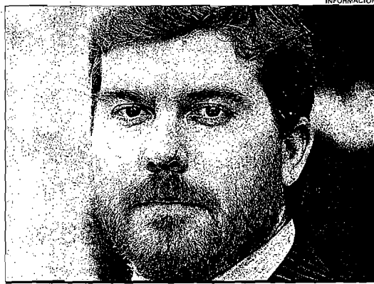
Eusebio Climent, presidente del Colegio de Mediadores de Seguros