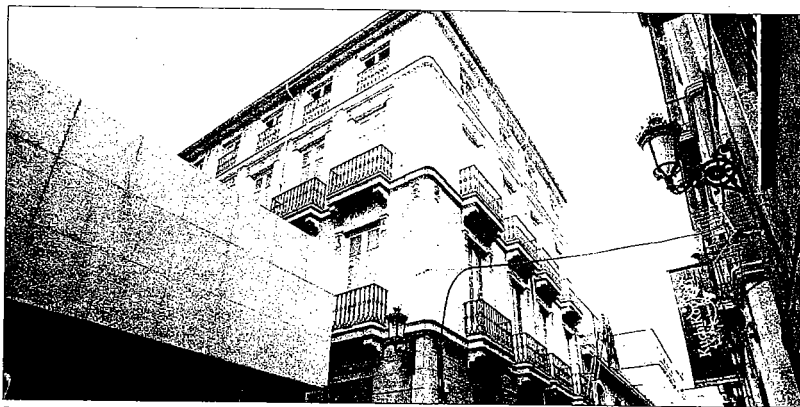
Fachada del edificio del Colegio de Economistas de Alicante, ayer.

El Colegio de Economistas apuesta por la innovación de sus programas y el desarrollo de planes que los equiparen con el mercado anglosajón